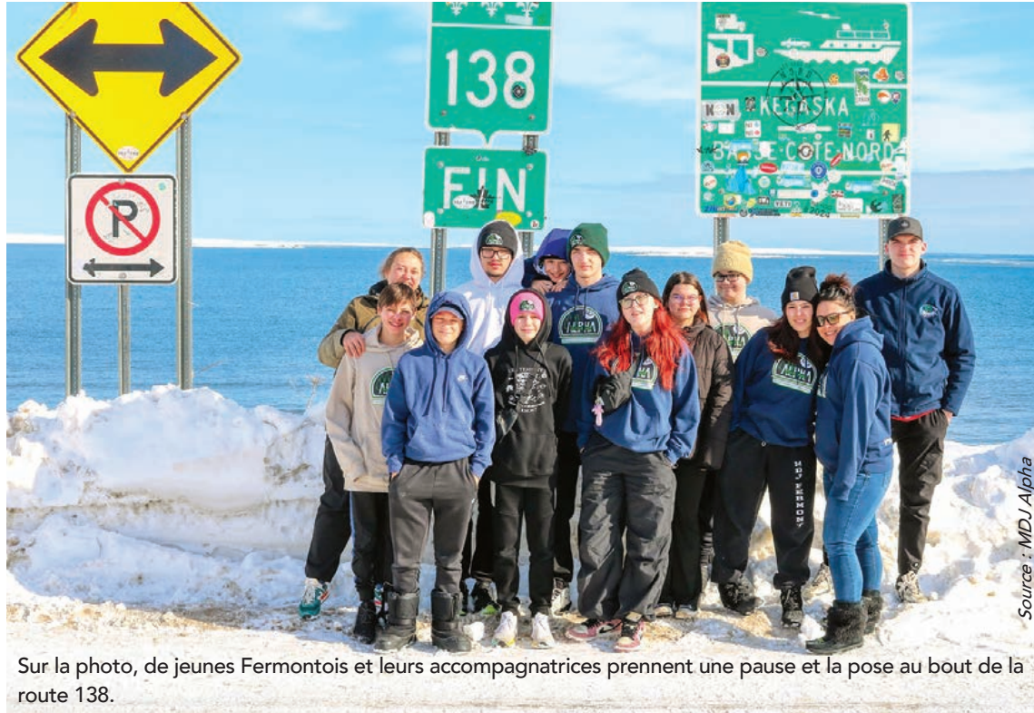
Sur la photo, de jeunes Fermontois et leurs accompagnatrices prennent une pause et la pose au bout de la route 138.