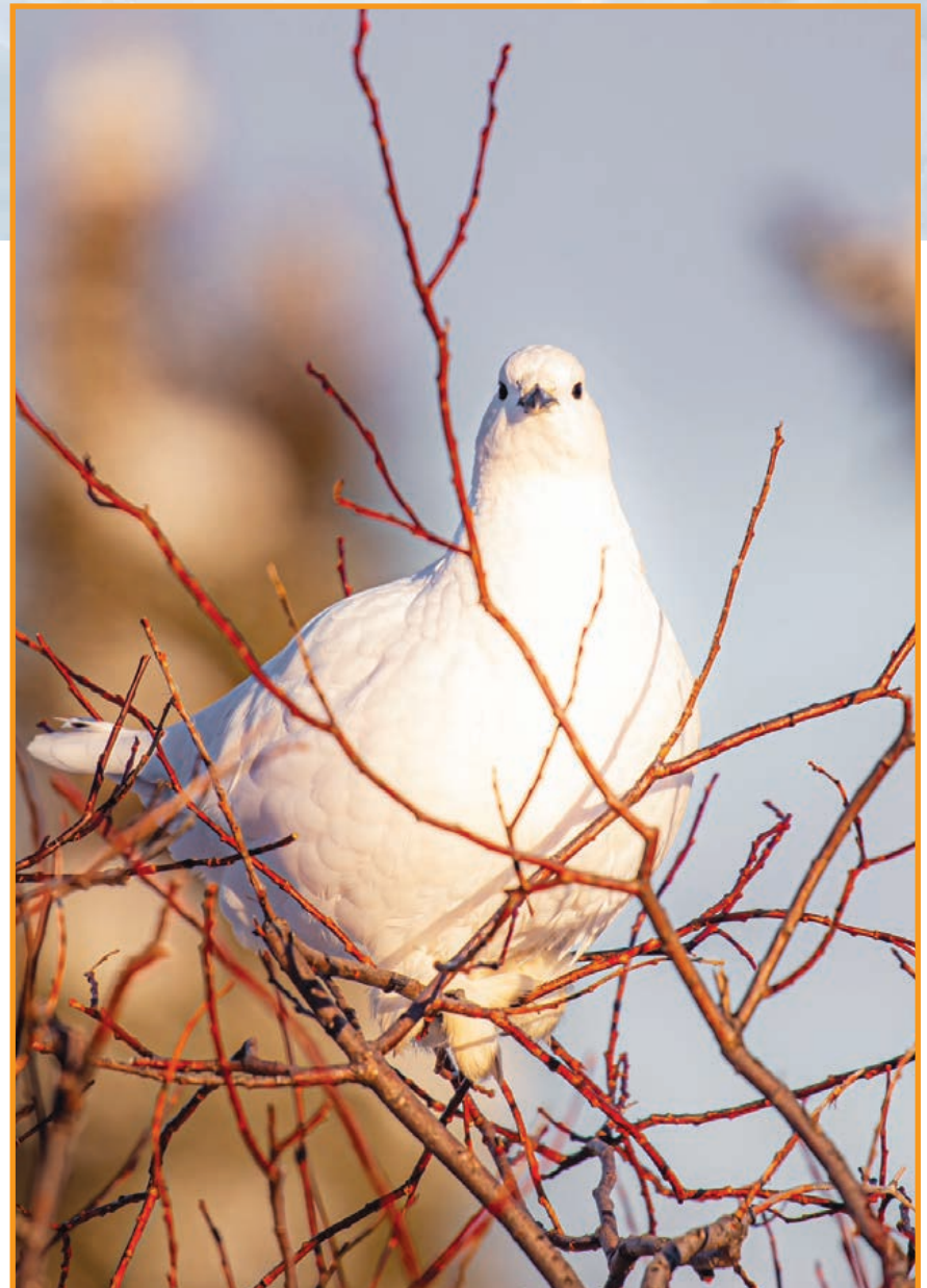
Gracieuseté de Hélène Miville