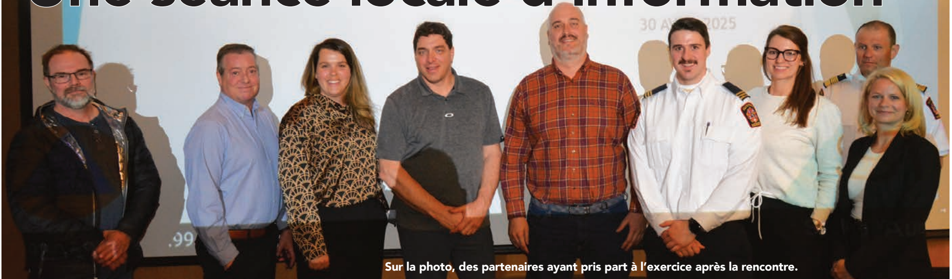
Sur la photo, des partenaires ayant pris part à l'exercice après la rencontre.

Une séance publique d'information relative à la sécurité civile à laquelle le public a été convié a eu lieu à la salle Aurora à Fermont, le 30 avril 2025. L'objectif était de renseigner les citoyens sur les mesures d'urgence en vigueur en cas de catastrophes naturelles ou autres.