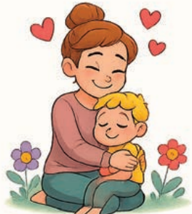
l'apaisement finit par s'installer.