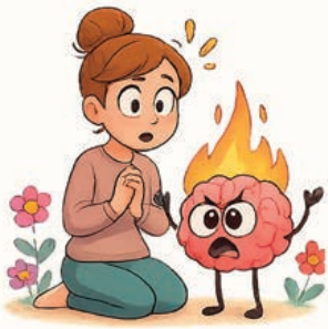
Quand l'émotion déborde...

Parce qu'un enfant a besoin d'un adulte calme pour retrouver son équilibre.