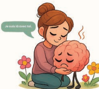
Avec de la douceur et de la proximité...