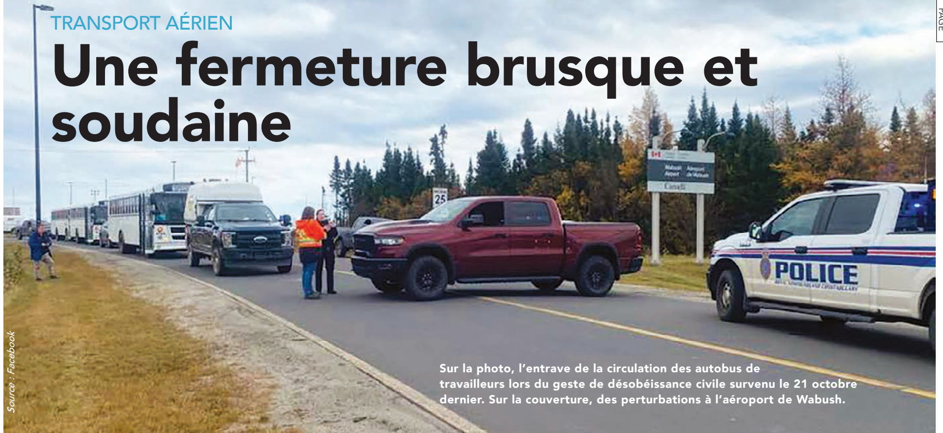
Sur la photo, l'entrave de la circulation des autobus de travailleurs lors du geste de désobéissance civile survenu le 21 octobre dernier. Sur la couverture, des perturbations à l'aéroport de Wabush.