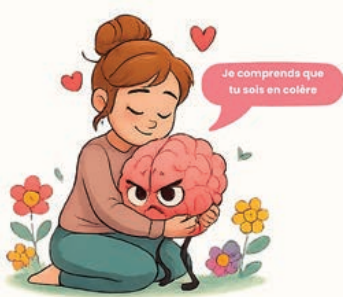
...il a surtout besoin d'être accueilli.