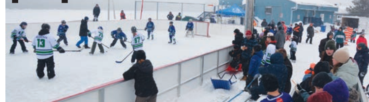
Sur la photo, la Classique hivernale 2026.

Deux tournois de hockey sur glace qui se sont déroulés à Fermont récemment ont attiré plusieurs équipes de différentes catégories, féminines, masculines et mixtes, ainsi qu'un public important. La cinquième édition du tournoi caritatif Bout d'souffle s'est tenu à l'aréna Daniel-Demers, du 19 au 21 février 2026, et la deuxième édition de la Classique hivernale à la patinoire extérieure du chalet de services de la Ville, le 7 mars.