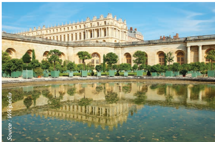
L'Orangerie du château de Versailles à proximité de Paris en France.

Au milieu du seizième siècle, les aristocraties britannique et française commencent à s'intéresser à la culture de plantes exotiques à fleurs et à fruits. Évidemment, le climat de ces pays ne le permettait simplement pas à l'extérieur. C'est ainsi qu'au début du dix-septième siècle, et ce jusqu'au dix-huitième siècle, des orangeries furent construites. De longs bâtiments en pierre assez haut avec de nombreuses grandes fenêtres afin de favoriser un maximum de luminosité. Certains de ces ouvrages architecturaux existent encore de nos jours dans de grands jardins d'Europe et l'on peut les visiter. On y cultivait des espèces fruitières exotiques, surtout des agrumes.