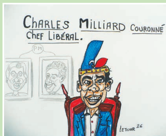
Une gracieuseté de Gilles « Letour » Létourneau, caricaturiste.