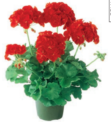
Un géranium rouge en pot.