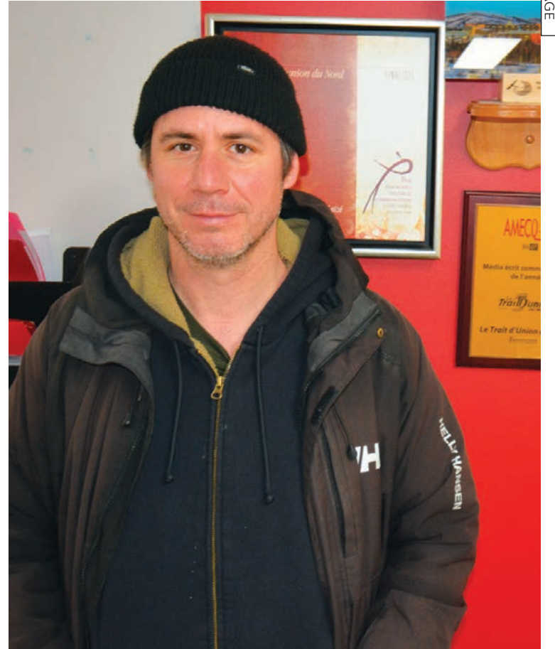
Sur la photo, le directeur général du journal Le Gaboteur dans les locaux du Trait d'union du Nord .